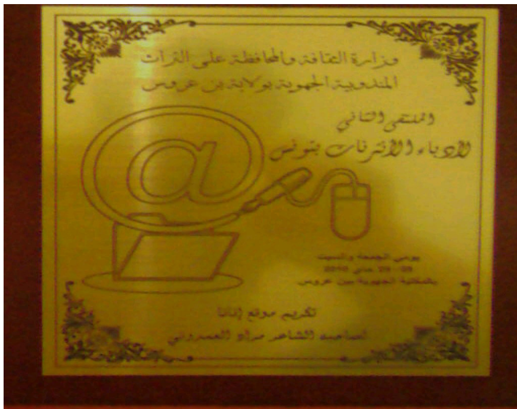
درع الملتقى لموقع -إنانا - و شهادة تكريم لمديره الشاعر مراد العمردوني